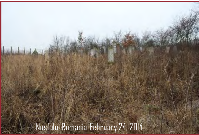
Nusfalu, Romania February 24, 2014

גרויס התעוררות ביי בני משפחה איבערצוביען דעם ביה"ח.